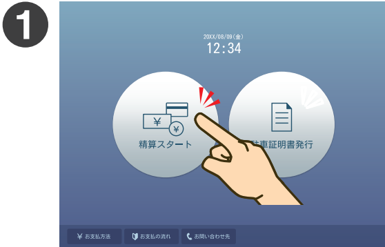
「精算スタート」をタッチしてください