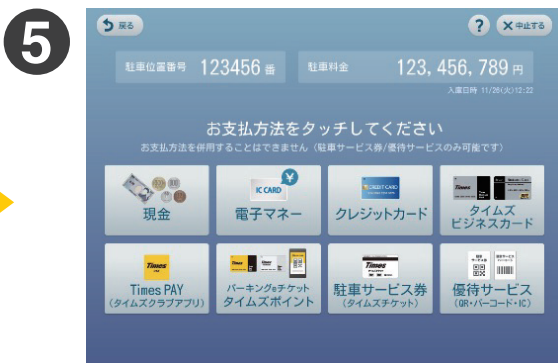
残額がある場合、お支払い方法を 選択の上精算してください