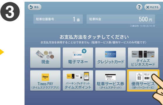
この画面になったら 「優待サービス」ボタンをタッチしてください