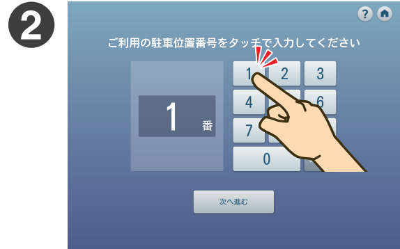
ご利用の駐車位置番号を入力して 「次へ進む」ボタンをタッチしてください