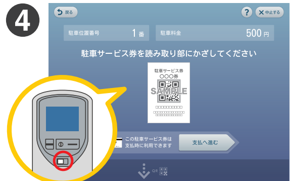
提携店舗でお受け取りの レシート型の券の二次元コードを 読み取り部にかざしてください